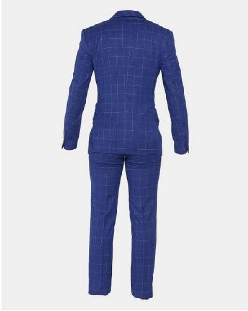
Vue de derrière