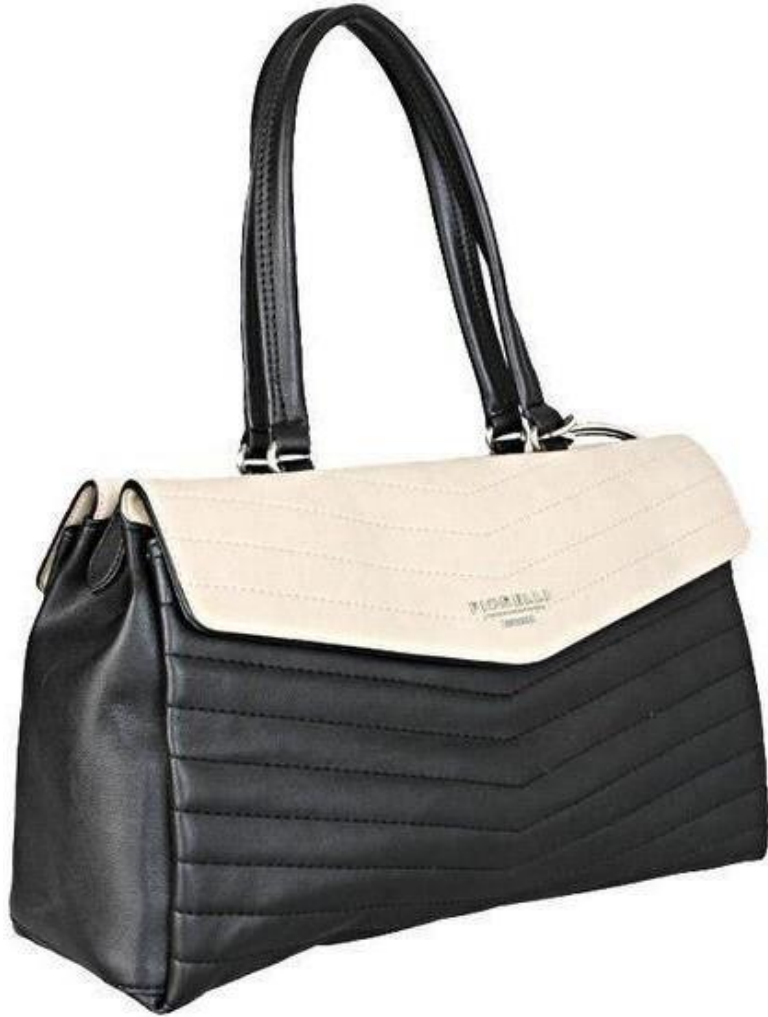
Vue de côté