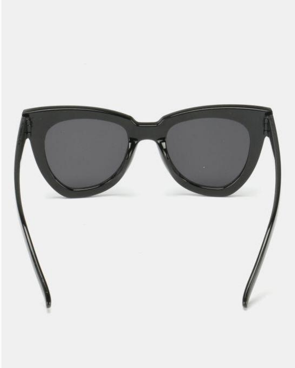
VUE DE L'INTÉRIEUR