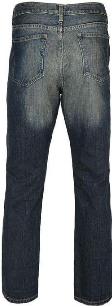
VUE DE DOS : MONTRANT LES POCHEs ARRIÈRE ET LES DÉTAILS DE LA BANDE