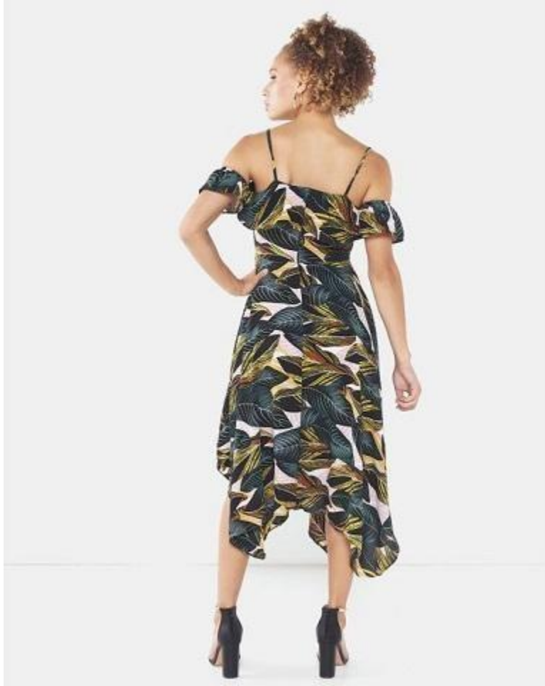
Vue de derrière