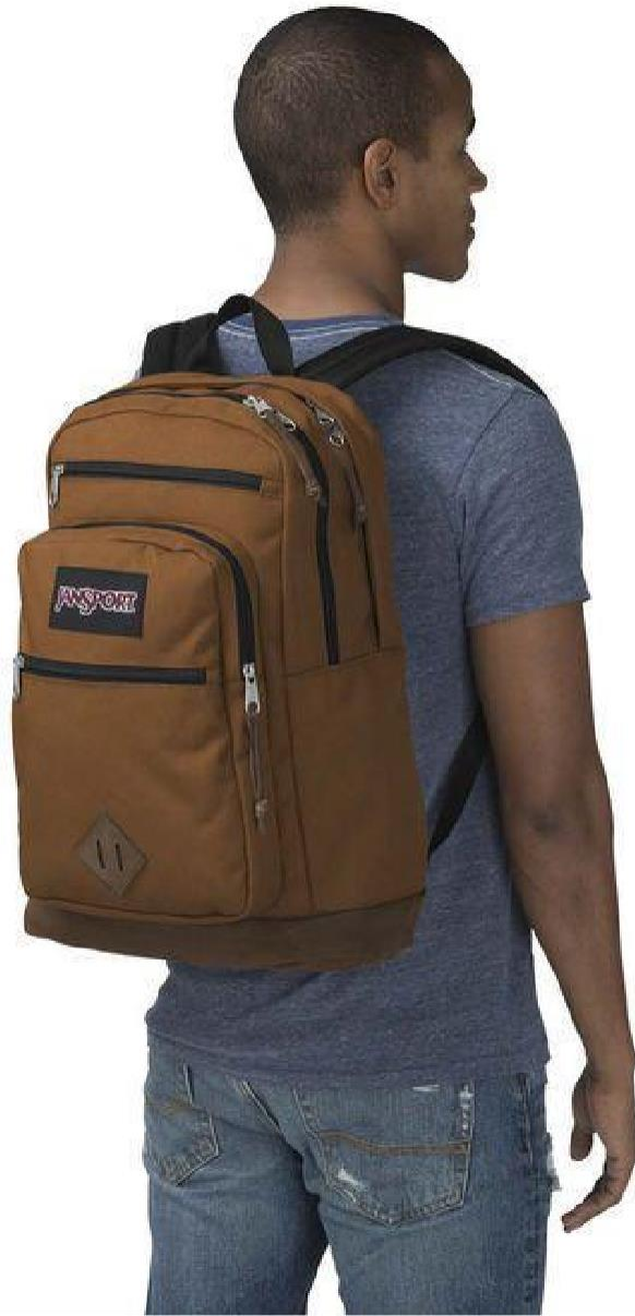
PHOTO DE STYLE