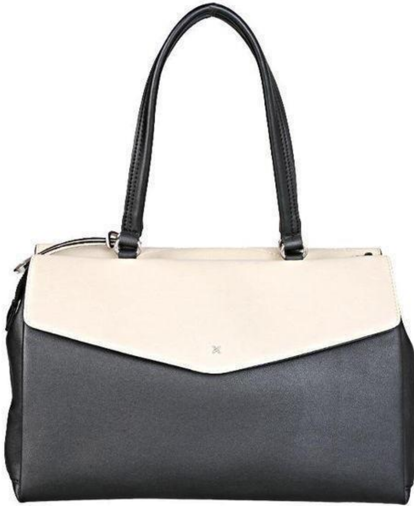
Vue de derrière