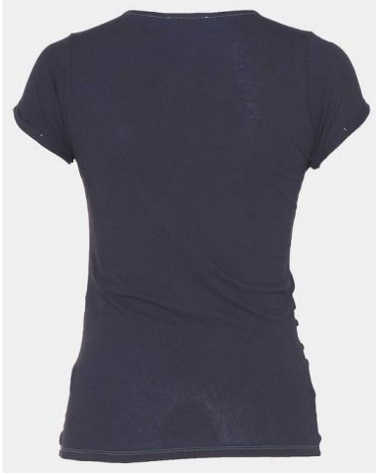
Vue de derrière