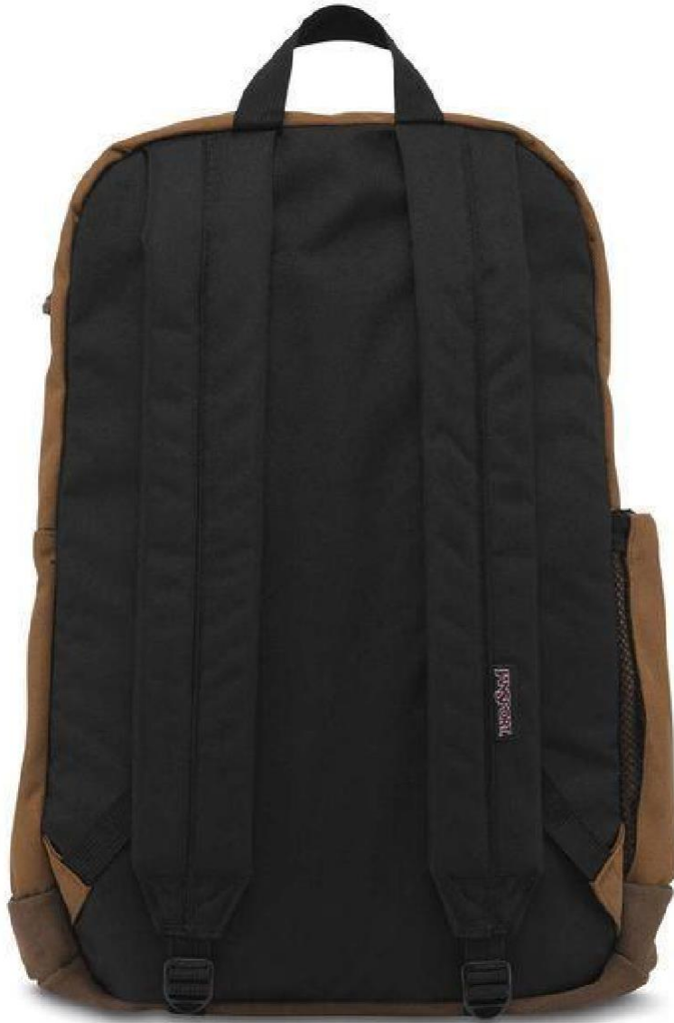
Vue de derrière