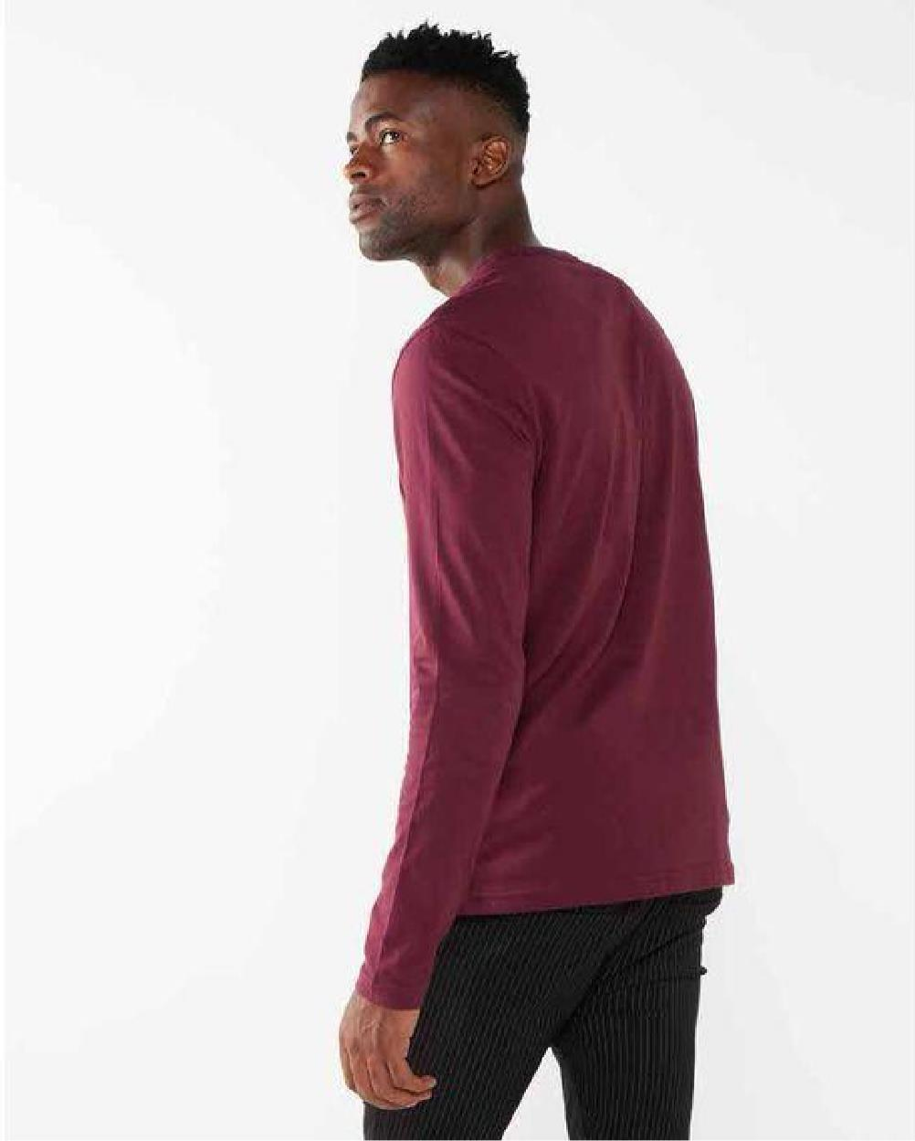
Vue de derrière