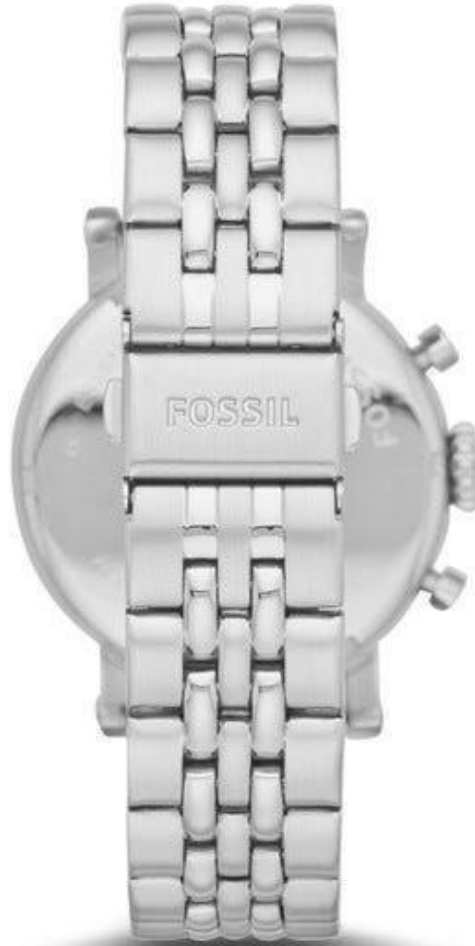
Vue de derrière