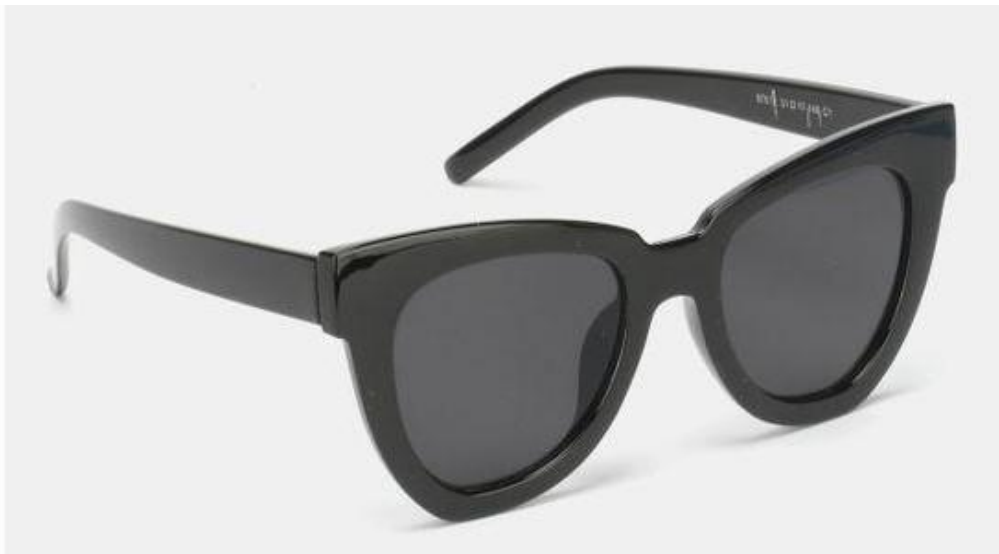
Vue de coté