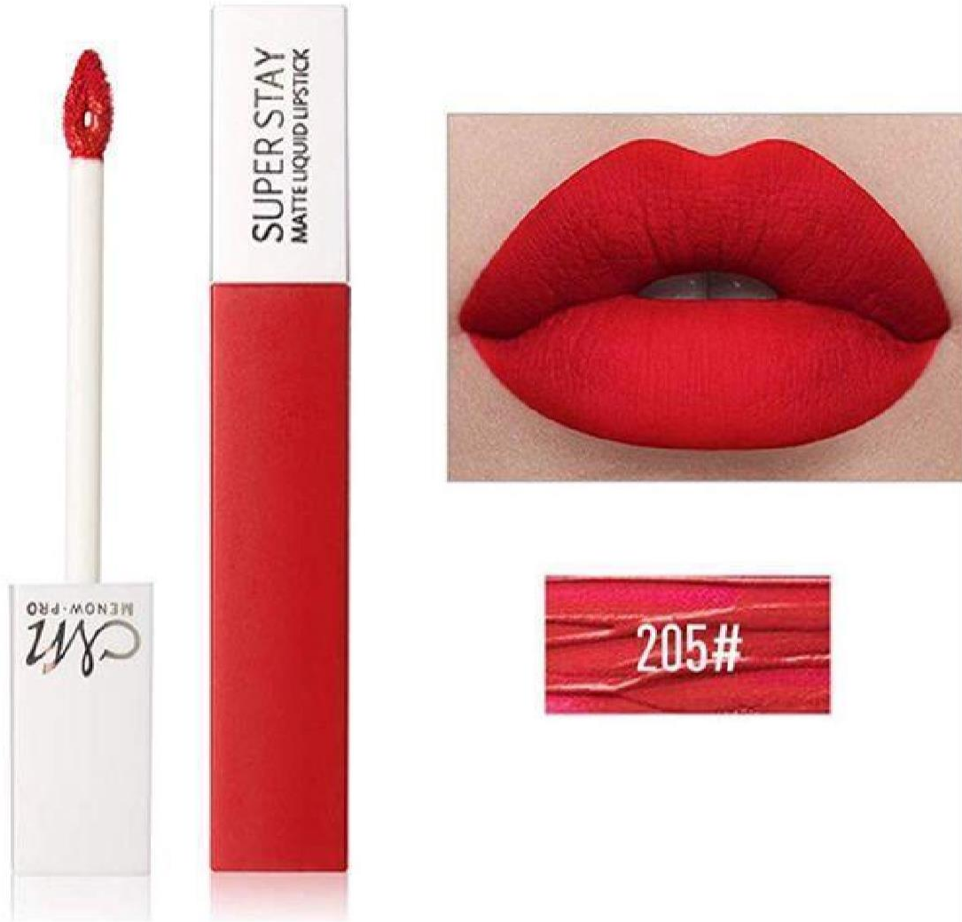
Photo de la tache de lèvres avec un échantillon inclus